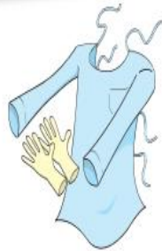
Luvas e Avental