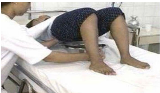
Figura 3. Encaixe da aparadeira sob as nádegas.