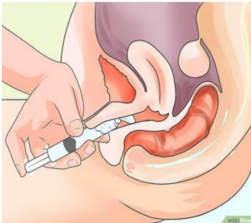
Figura 1. Administração de medicação via vaginal.